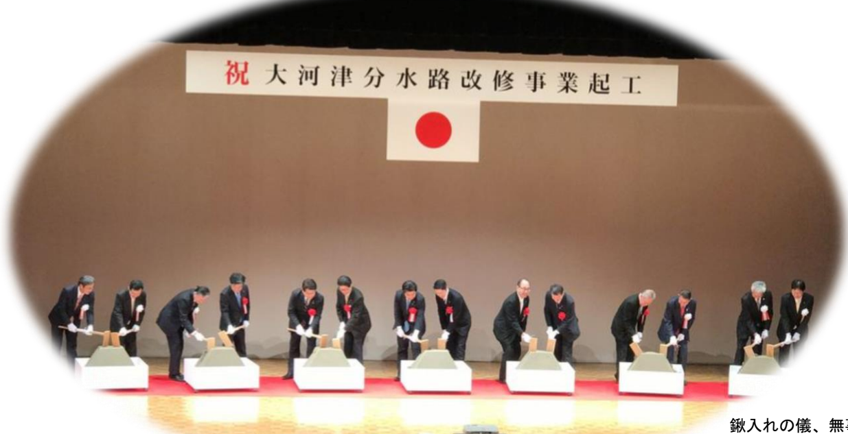
鍬入れの儀、無事に執り行われました。

一般財団法人先端建設技術センターは、本式典においてCIM及びVR技術を使った鍬入れ体験の技術支援を行いました。