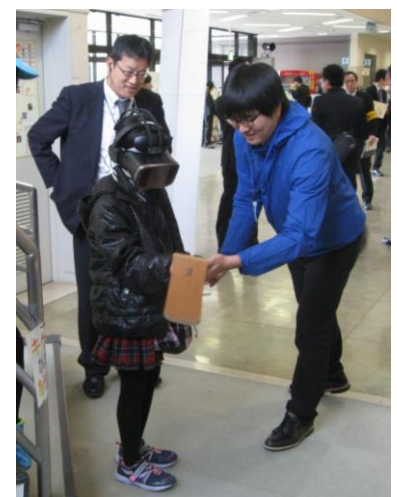
VR技術を活用した鍬入れの儀システムとバーチャル体験をする小学生